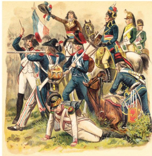
Les hussards resteront.