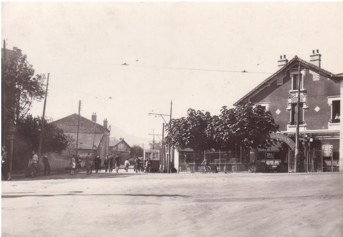
L'arrêt et le terminus du tram de la rue de Beaumont, chez Morlé.