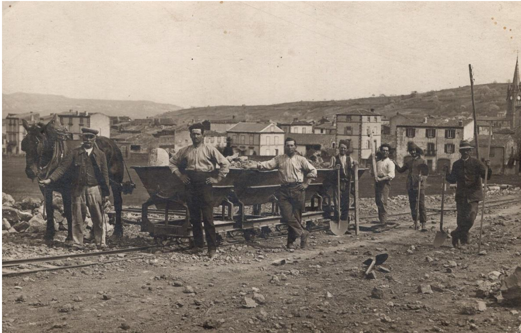
Les travaux d'aménagement de la future avenue d'Aubière

Des travaux d'une ampleur colossale seront entrepris au milieu des années 1920. Pour le maire Noëllet la venue du tramway à Aubière était devenue une priorité. Dès 1920, le conseil municipal avait envisagé la construction d'une large avenue d'Aubière à Clermont pour le passage du tramway. L'élargissement de la voie au-dessus de la Cave Madame nécessitera l'usage de puissants explosifs comme la dynamite.