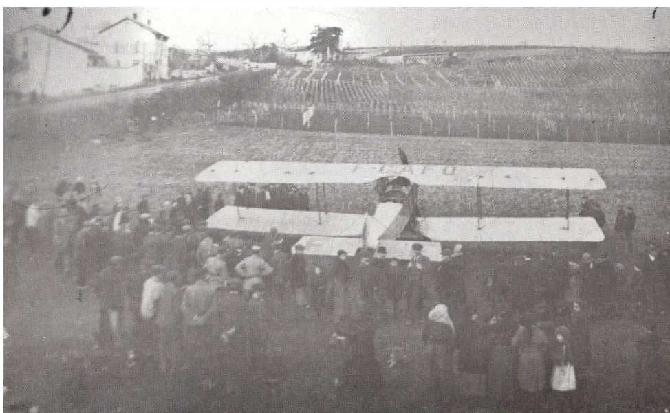
Un coucou, contraint d'atterrir, a « raté » l'avenue, au début des années 1930.