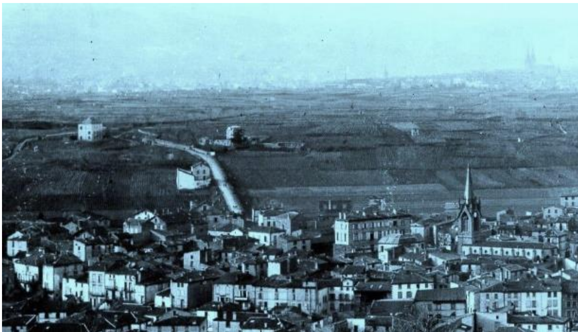
L'avenue Jean Noëllet vers 1928