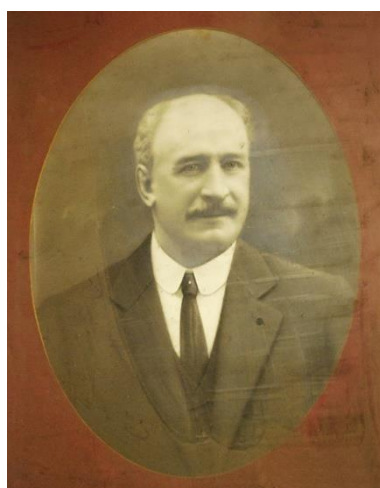
Jean Noëlllet, maire d'Aubière de 1912 à 1929