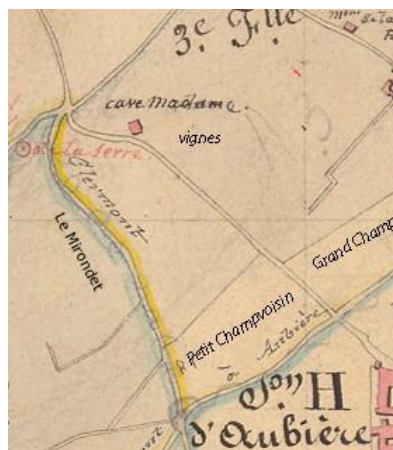
Chemin de la Cave Madame d'après le cadastre de 1831 (A.D. 63)

Jusqu'aux années 1920, ce chemin (carrossable) s'arrêtait à la cave Madame. Les Aubiérais allaient à Clermont soit par la rue Pasteur soit par le Mirondet qui prolongeait la route venant de Prat. Le maire de l'époque, Jean Noëllet, dit le Rapide, prend alors la décision, avec son conseil municipal, d'élargir la coulée volcanique pour atteindre le plateau des Cézeaux. De la cave Madame, il était seulement accessible par un étroit chemin qui menait au carrefour du Mas.