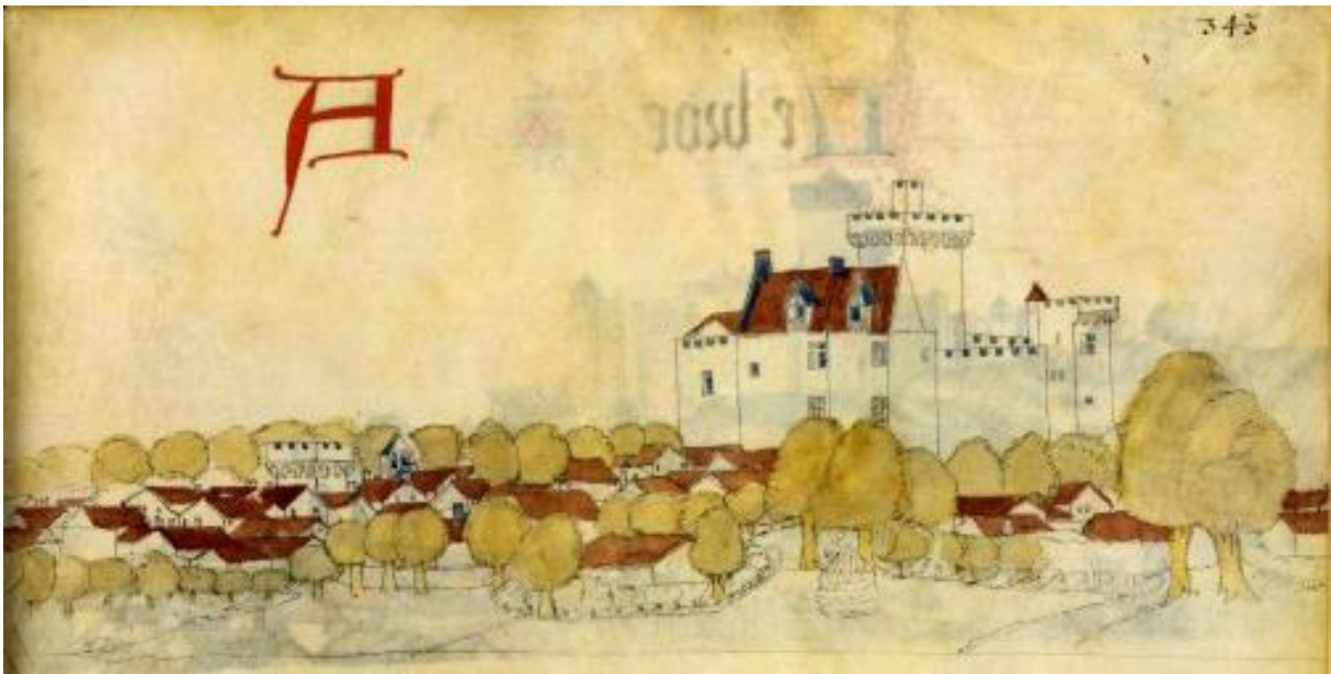
En bas et à droite, c'est la première représentation du chemin de la future cave Madame en 1450. (Archives nationales, BNF, Guillaume Revel, Français 22297, page 343)