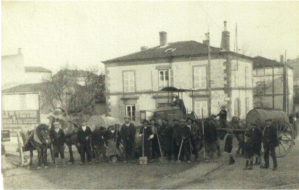
Le goudronnage de l'avenue. Les ouvriers au carrefour Champvoisin-Noëllet.