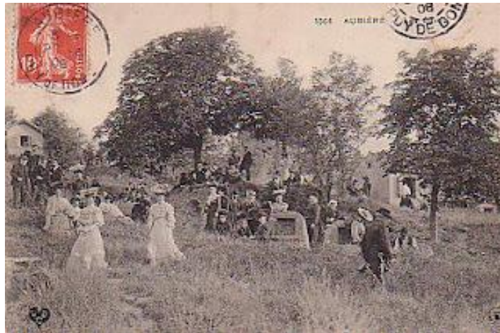
Lors de la saint Loup, les belles venaient parader. Ici en 1904.

Fête patronale. Le premier dimanche de septembre, Aubière fête son saint patron : saint Loup. Autrefois, comme aujourd'hui, cette fête patronale était très appréciée et toujours très populaire. On venait de loin pour participer à la reine des fêtes d'Aubière.