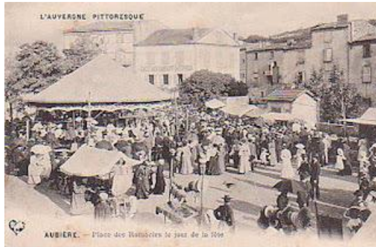
Place des Ramacles lors de la saint Loup en 1905