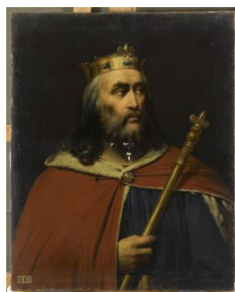
Clotaire II, roi des Francs

Saint Loup ou Leu ( Lupus en latin ) est né d'une famille illustre, près d'Orléans, vers 573. Ses parents, Beto et Austregilde, lui assurent une éducation soignée ; à l'école, il surpasse tous les autres élèves. Il fait preuve d'une grande piété et d'un grand ascétisme : attentionné envers les pauvres, il pratique la charité avec application. Sa réputation est telle qu'il est élu évêque de Sens à la mort d'Arthemius. Proche de la dynastie mérovingienne, il se rebella pourtant contre le roi des Francs Clothaire II qui l'exila.