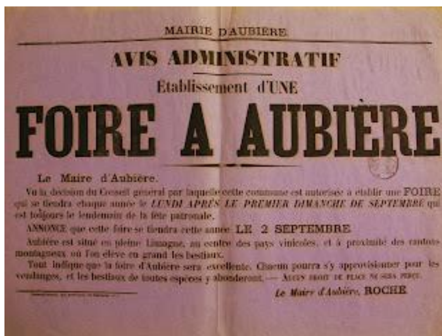
L'avis qui crée la Foire de la Saint-Loup en 1869