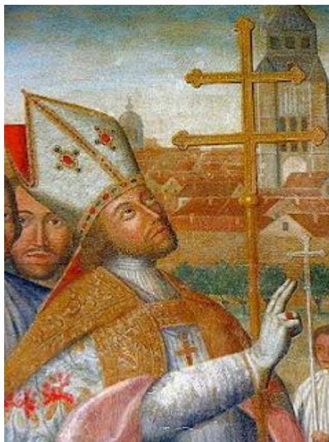
Saint Loup, évêque de Sens

Saint Loup ou Leu ( Lupus en latin ) est né d'une famille illustre, près d'Orléans, vers 573. Ses parents, Beto et Austregilde, lui assurent une éducation soignée ; à l'école, il surpasse tous les autres élèves. Il fait preuve d'une grande piété et d'un grand ascétisme : attentionné envers les pauvres, il pratique la charité avec application. Sa réputation est telle qu'il est élu évêque de Sens à la mort d'Arthemius. Proche de la dynastie mérovingienne, il se rebella pourtant contre le roi des Francs Clothaire II qui l'exila.