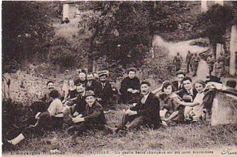
Saint Loup 1925 : sur les caves en famille.

Le dessus des caves grouillait de tout ce monde endimanché venu déguster l'oie arrosée d'un petit vin frais à peine sorti des caves.