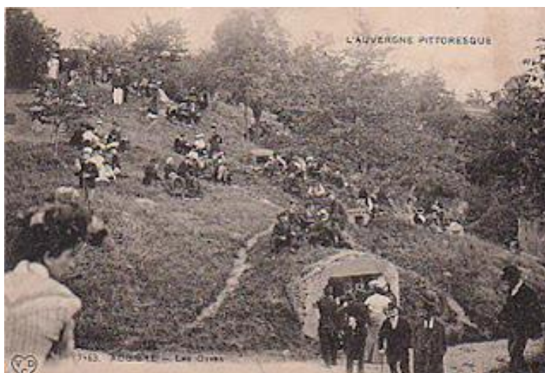
Saint Loup 1904 : "les vigneron ouvraient leurs caves..."

Le dimanche de la saint-Loup, la rue des Grandes Caves se noircissait de monde, de ceux qui, l'oie sous un bras, la brioche sous l'autre, allaient festoyer, assis sur l'herbe verte et adossés aux soupiraux crevant la colline, tels de monstrueux périscope.