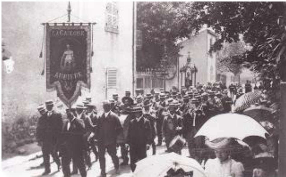
L'harmonie "La Gauloise" devance la statue de saint Loup lors de la procession en 1913 Rue Vercingétorix

Si l'église d'Aubière avait déjà saint Martin pour patron, dorénavant, la paroisse aura pour vocable saint Loup.