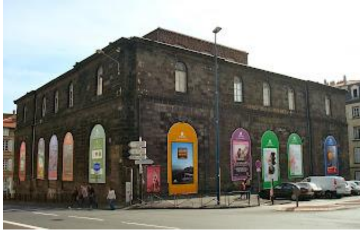
Ancienne Halle aux blés de Clermont-Ferrand