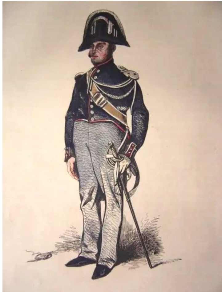
Le gendarme (Gravure d'Henri Monnier, 1840)