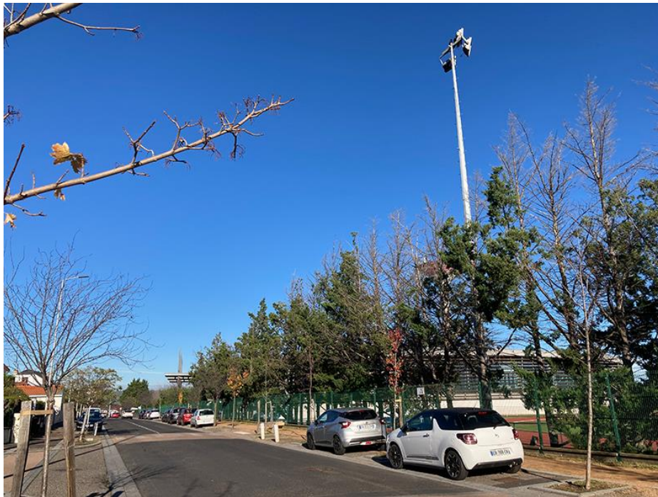
Le Stade Pellez se cache sur le plateau des Cézeaux

Au sommet de la côte, en arrivant sur le plateau des Cézeaux, on trouve sur la droite la croix de l'Arbre . Un peu plus loin le stade Pellez et le complexe universitaire.