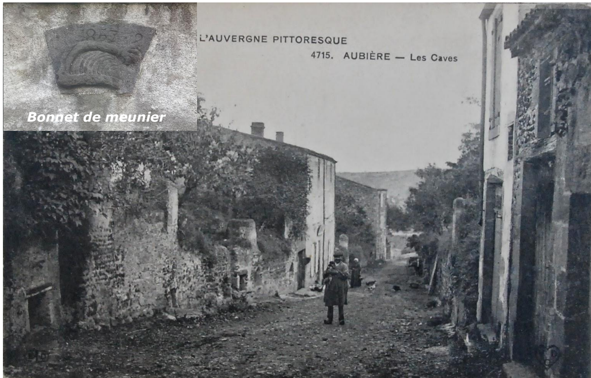
Bonnet de meunier