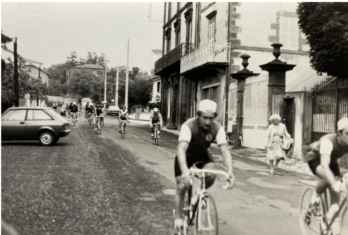
Une course cycliste en 1972, descendant la rue Pasteur, passe devant la maison Casati (à droite)

On a remarqué un peu plus tôt sur la droite, à l'angle de la rue éponyme, un bâtiment remarquable : la « Maison Casati », comme on l'appelle aujourd'hui et depuis que Joseph Casati, docteur en médecine, tout aussi remarquable, en est devenu le propriétaire aux alentours de 1900. Elle avait été bâtie par Jean Gioux, courtier et commissionnaire en vins, durant la seconde moitié du XIX ème siècle.