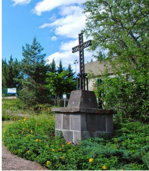
La croix de l'Arbre

Au sommet de la côte, en arrivant sur le plateau des Cézeaux, on trouve sur la droite la croix de l'Arbre . Un peu plus loin le stade Pellez et le complexe universitaire.