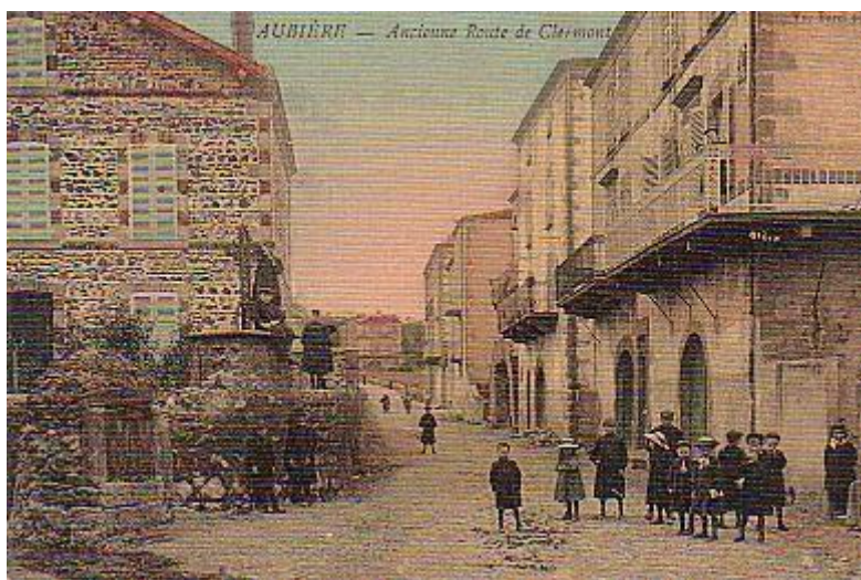
Au bas de la route de Clermont, la croix du Ventadour, à la droite d'un puits public, aujourd'hui disparu

Cette voie était, avant 1928, l'axe principal pour aller d'Aubière à Clermont, à partir de la Porte de la Quaire, par le chemin des Meuniers, puis l'actuel boulevard Lafayette à Clermont-Ferrand. L'avenue Jean-Noellet la supplantera.