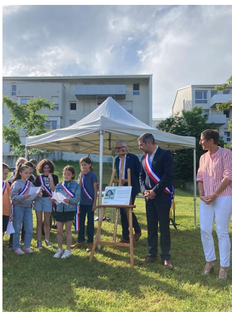
Nos édiles et le conseil municipal des Jeunes

Un peu plus haut sur la droite, à l'embranchement de la rue Roche-Genès, un square a été récemment inauguré (ci-dessous et le 19 juin 2024) : le square Anne Franck.