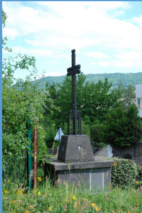
La croix de l'Arbre